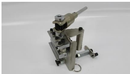
タイルメクリックス