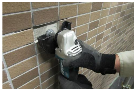
③サイカップでタイル撤去面に残った張付けモルタルを除去します