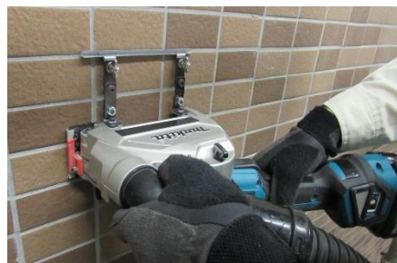
①サイカッターで撤去するタイルの四周目地を切断します