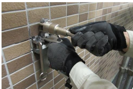
②タイルメクリックスでタイルを挟み、めくり取ります