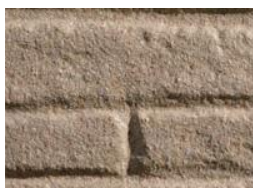
下地：サイディングボード