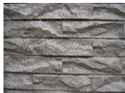
下地：コンクリート打ち放し 石調型枠仕上面