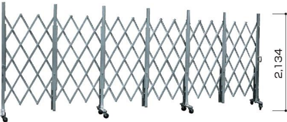
■ サイクルクロスゲート (CXGA-2054)