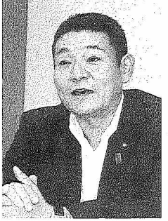
笠浩史氏 民主党衆議院議員、当選8回。現在は、民主党国会対策委員長、文部科学委員会常務。慶大卒、45歳。